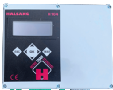
Styrskåp utrustat med Halsang H104-styrenhet.