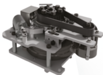
Korsmekanism – kvalitetsbroms med kort svarstid.